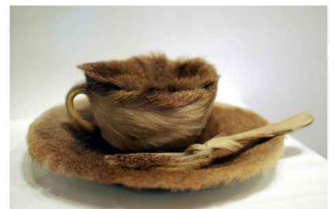
Meret Oppenheim, « Le déjeuner en fourrure »

C'est exactement ce que nous souhaitons faire apparaître dans notre spectacle en mêlant la rencontre d'un homme et d'une guenon, qui feront naître un monde ébouriffé et sensuel, le temps d'un spectacle.